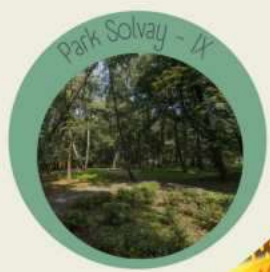
Park Solvay - IX