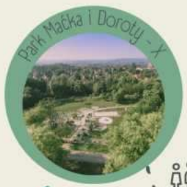
Park Maczka i Doroty - X