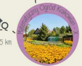
Matematyczny Ogród Krakowian - X