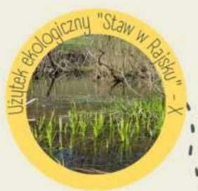
Użytek ekologiczny "Staw w Rajsku" - X

Dzielnica X (oraz IX) - Swoszowice (oraz Łagiewniki)